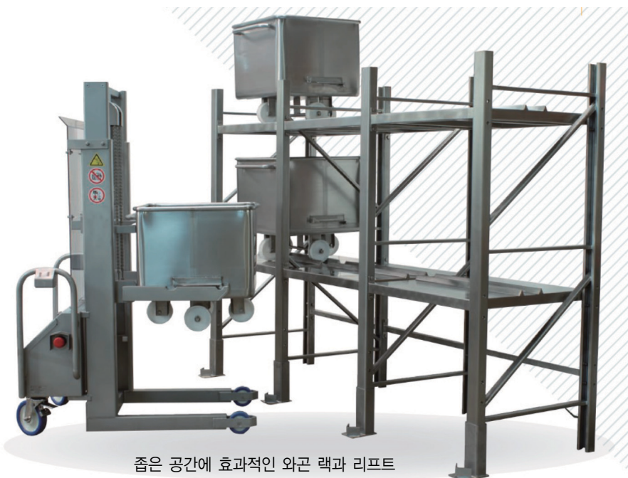
좁은 공간에 효과적인 와곤 랙과 리프트