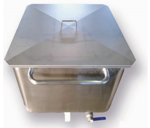
와곤 커버와 커스텀 가능한 드레인 홀